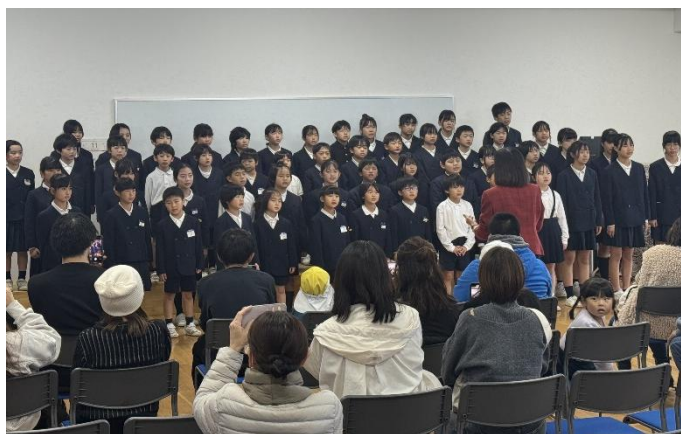
小学校全校児童による合唱