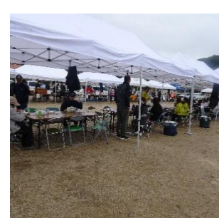
ふれあいスペース