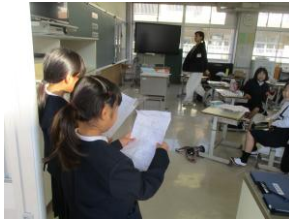
他学年訪問 呼び掛け

◆今年のTHE・SHINKURO(ガッガ-)は、5年1名・4年3名をリーダーに、3年5名・1-2年各1名と、中学年が多い可愛いチームで頑張っています♡