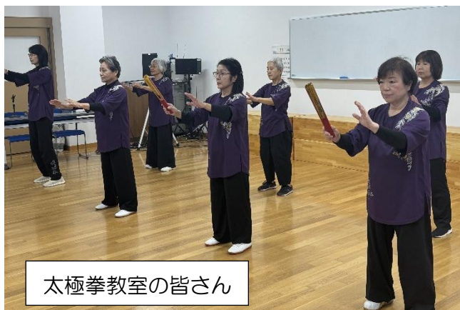
太極拳教室の皆さん