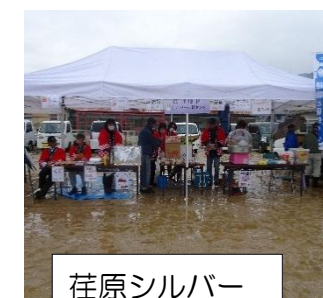
荏原シルバー 人材センター