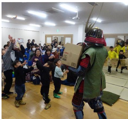
子ども神楽で福の種まき