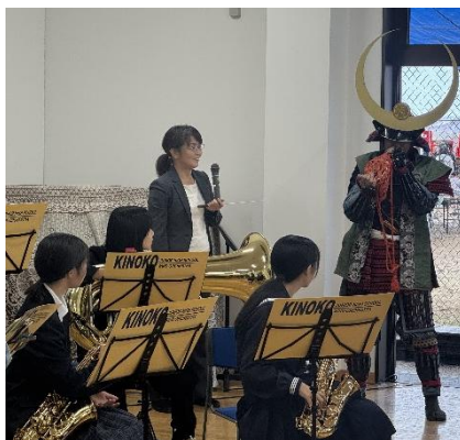
宇喜多秀家がほら貝披露