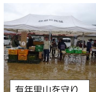
有年里山を守り 育てる会