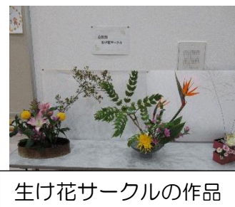
生け花サークルの作品