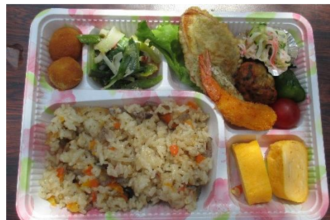
お花見弁当 500 円