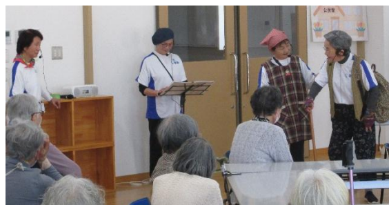
ボランティアグループ「じあい」の寸劇(4/21)