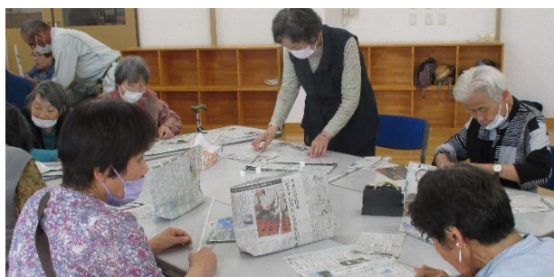
井原市社会福祉協議会の「ペーパークラフト」(6/2)