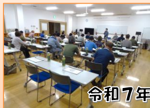
令和7年度 評議員会

5月16日(金)に令和7年度の評議員会が開催され、令和6年度の事業報告・決算と令和7年度の事業計画・予算案が承認されました。