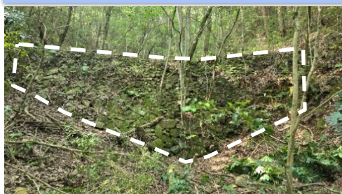
石組み全景 巾約11m 高さ約4.5m