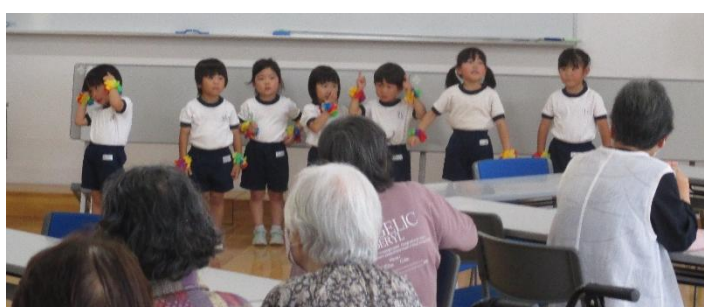
幼稚園児とのふれあい (6/16)