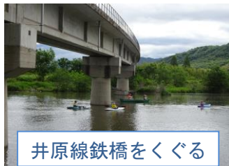
井原線鉄橋をくぐる