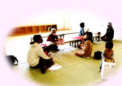
荏原公民館の和室で