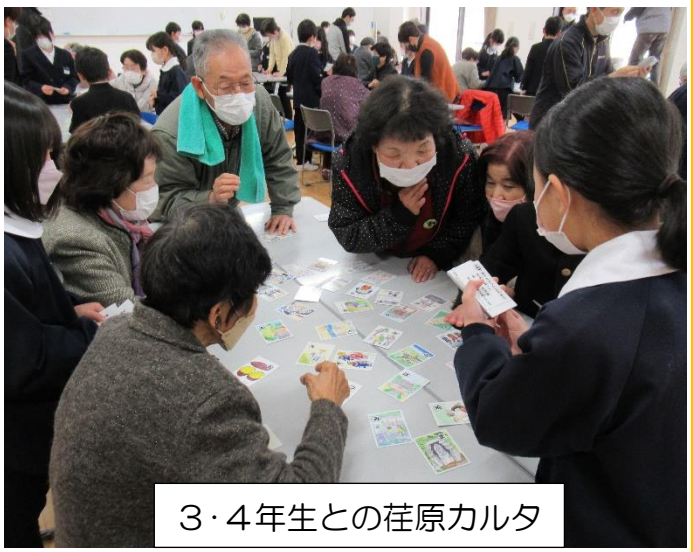
3・4年生との荏原カルタ

公民館の建替えやコロナ禍で児童とのふれあいができない時期が続きましたが、今年度は全学年の園児・児童とふれあう機会を持つことができました。「ふれあい広場」に参加してくださっている高齢者の皆さんにも大変好評でした。