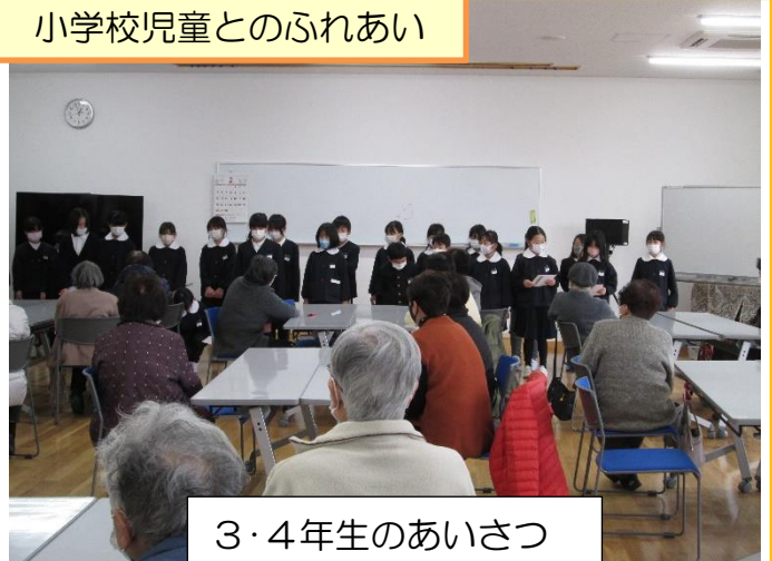
3・4年生のあいさつ