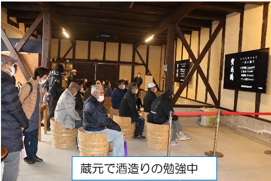
蔵元で酒造りの勉強中