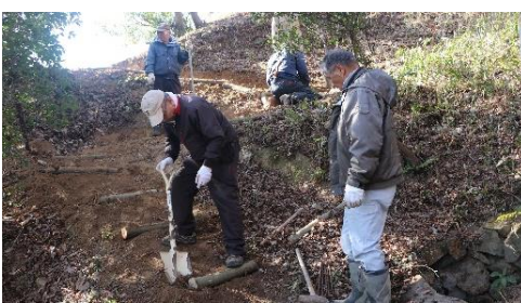
3月5日清掃 道路整備