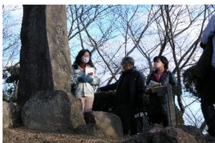
1月4・5日山城ガール案内