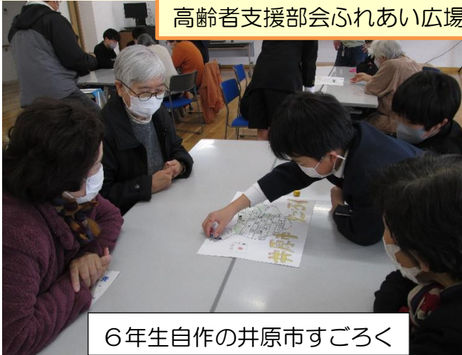
6年生自作の井原市すごろく