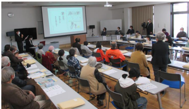
R4.12.18 『早雲の里荏原カルタ』完成披露会