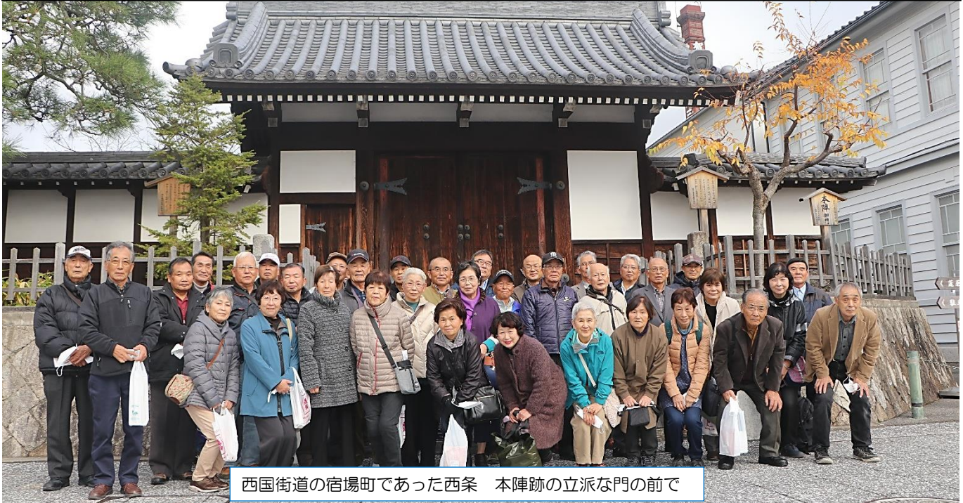
西国街道の宿場町であった西条 本陣跡の立派な門の前で

12月1日（木）、東広島市西条の酒蔵通りとクリームパンで有名な三原八天堂に行ってきました。西条では、林立する赤レンガの煙突・赤瓦の屋根・なまこ壁の風情ある街並みを散策し、蔵元で試飲を楽しみました。八天堂パン屋では、クリームパンの製造工程をビデオで見た後、パンの袋詰め体験をしました。3年ぶりの研修視察ということで多くの方が参加してくださったので、親睦を深めることができ、笑顔あふれる1日となりました。