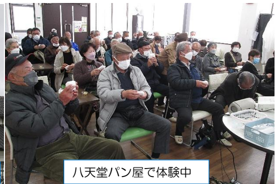
八天堂パン屋で体験中