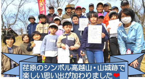
荇原のシンボル高越山・山城跡で 楽しい思い出が加わりました♥