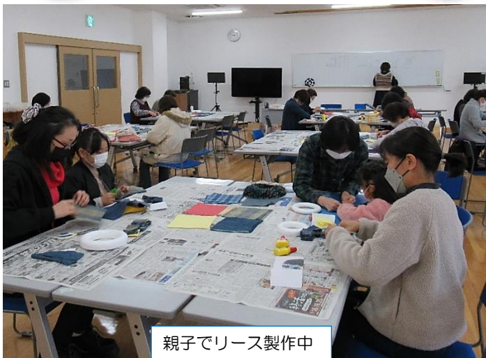
親子でリース製作中

12月11日（日）日本綿布様からデニム生地を提供いただき、もの作り講座を開催しました。4cm四方のデニム生地を発泡スチロールの台に差し込むという作業に、みなさん集中して取り組んでおられました。同じ材料なのに、一人一人違った個性豊かなリースを作ることができました。