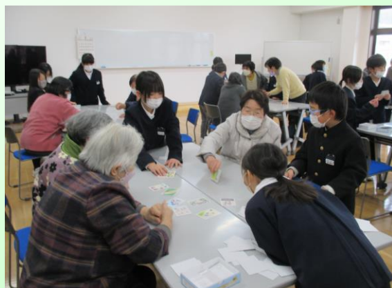
R5.2.6 高齢者とカルタで交流する3-4年生