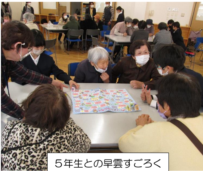
5年生との早雲すごろく