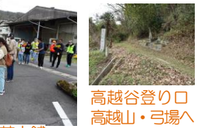
高越谷登り口 高越山・弓場へ