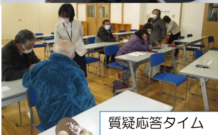
質疑応答タイム 熱心に質問中